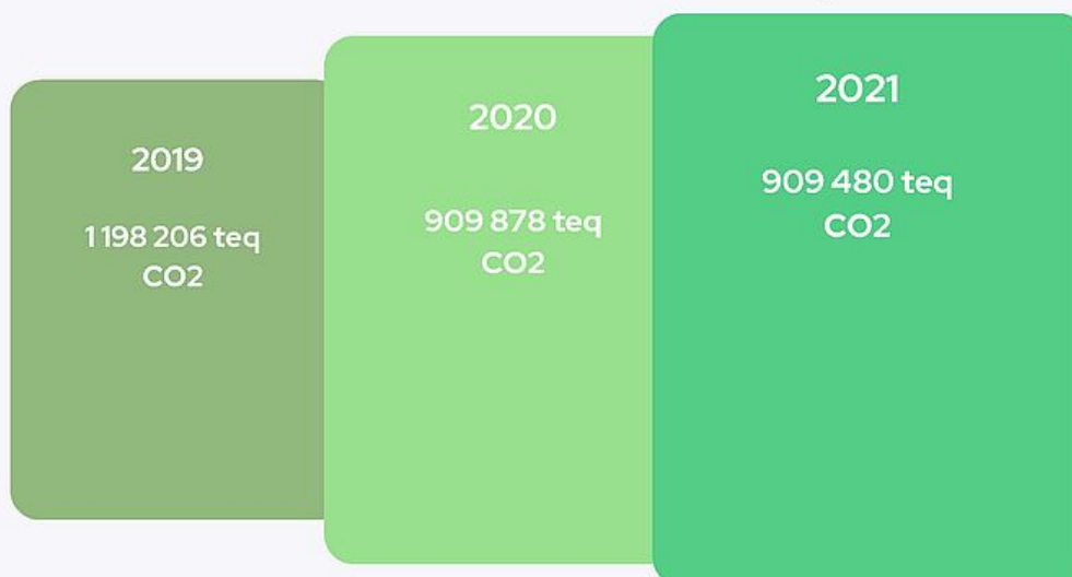
Tableau de bord climatique

Les données retraitées du CF 2021 selon la méthode présentée sont reprises ci-dessous :