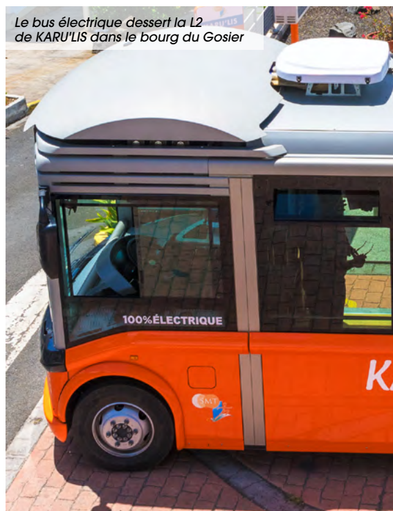
Le bus électrique dessert la L2 de KARU'LIS dans le bourg du Gosier