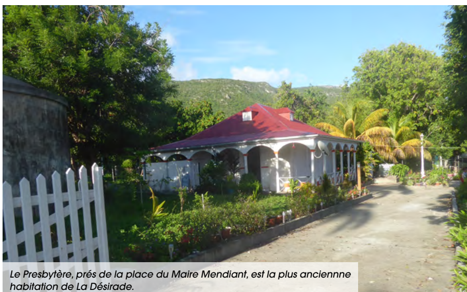
Le Presbytère, près de la place du Maire Mendiant, est la plus ancienne habitation de La Désirade.