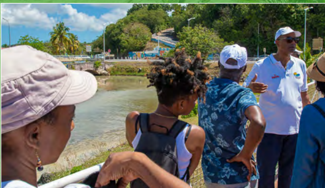
Marche exploratoire de la frange du littoral

Une marche à laquelle ont participé les techniciens de la CARL en charge de l'Aménagement, de l'Environnement, du Développement Économique et du Tourisme, accompagnés de représentants de la DEAL, de l'Agence des 50 pas Géométriques et du Syndicat Mixte des Transports.