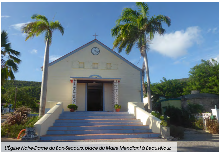
L'Église Notre-Dame du Bon-Secours, place du Maire Mendiant à Beauséjour.