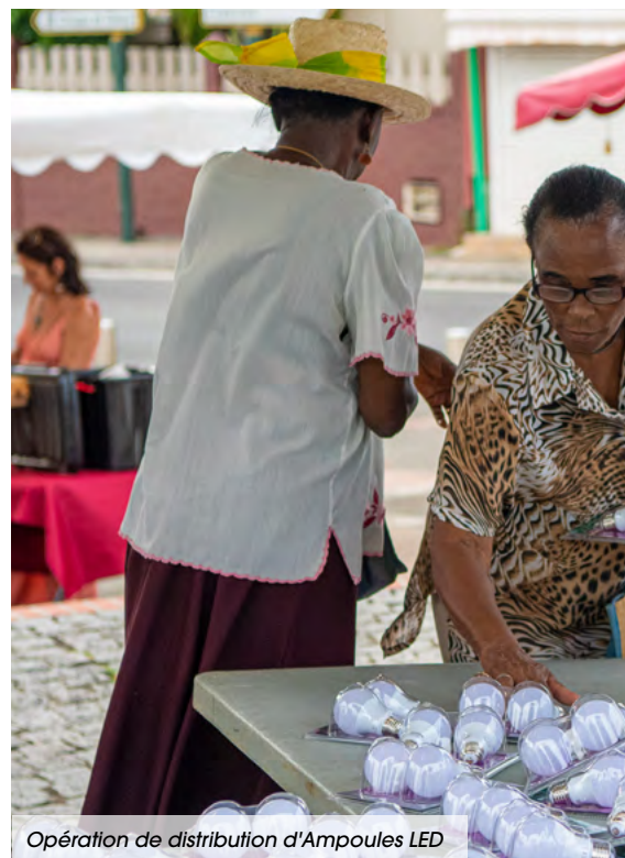
Opération de distribution d'Ampoules LED

En sa qualité de nouveau TEPCV, la CARL va devoir conduire d'autres actions qui concourent à la préservation de l'environnement et au développement des énergies propres à l'instar de l'opération de distribution gratuite de 2000 ampoules LED menée en collaboration avec EDF Archipel Guadeloupe au mois d'avril dernier.