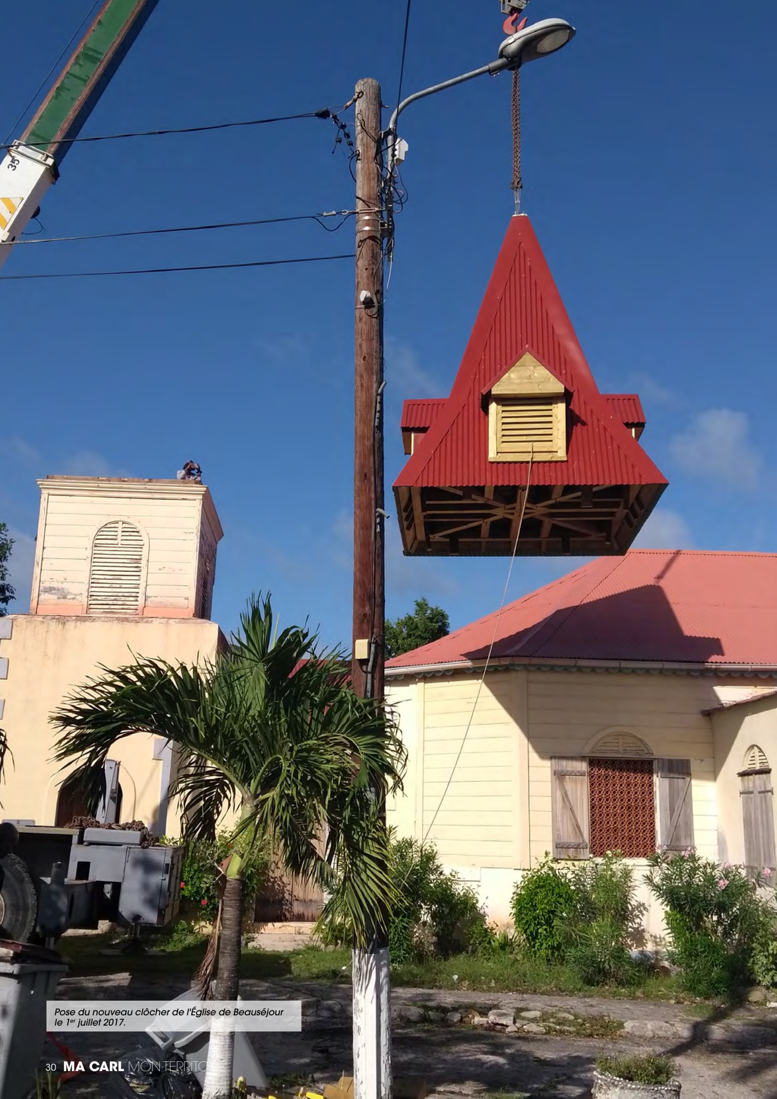
Pose du nouveau clocher de l'Église de Beauséjour le 1 er juillet 2017.