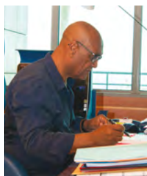
Jean-Pierre DUPONT, Président de la Communauté d'Agglomération la Riviera du Levant